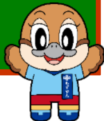
大阪府広報担当副知事 もすやん