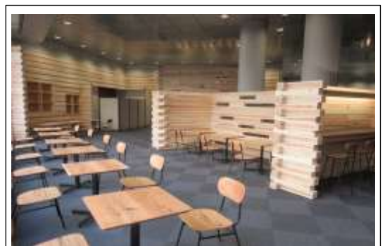
【府立中央図書館内装の木質化】

今後ともウィズコロナの状況や中之島図書館の書庫建替工事に係る施設の状況等を踏まえつつ、企画の工夫などを重ねたいと考えています。