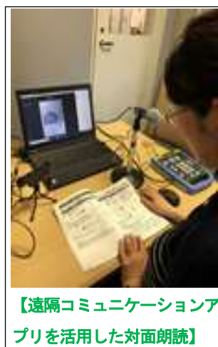
【遠隔コミュニケーションアプリを活用した対面朗読】

ビジネス支援サービスでは、募集人数を絞り、会場での感染拡大防止にも努め、7月からビジネスセミナーを実施しましたが、講師の確保などが難しく目標値どおりの回数での開催ができませんでした。ホームページのビジネスWeb情報源の更新、所蔵新着雑誌記事速報の公開など、非来館者へのサービス提供に努めました。