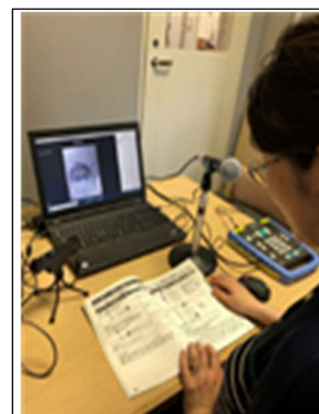
【遠隔コミュニケーションアプリを活用した対面朗読】

ビジネス支援サービスでは、募集人数を絞り、会場での感染拡大防止にも努め、7月からビジネスセミナーを実施しましたが、講師の確保などが難しく目標値どおりの回数での開催ができませんでした。ホームページのビジネスWeb情報源の更新、所蔵新着雑誌記事速報の公開など、非来館者へのサービス提供に努めました。