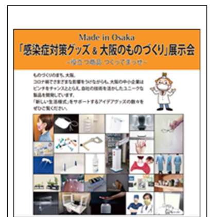
【「感染症対策グッズ&大阪のものづくり」展示会 ポスター】

今後とも魅力ある事業の企画など工夫を重ねるとともに、目標設定においては、with コロナの状況や中之島図書館の書庫建替工事に係る施設の状況等を踏まえて、見直しを図りたいと考えています。