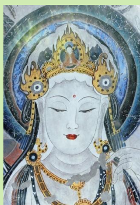
敦煌の壁画の菩薩像