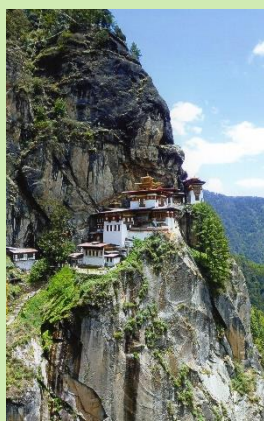
ブータンのタクツァン僧院