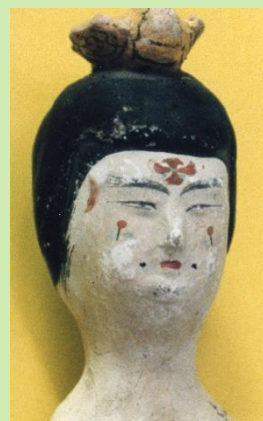
高昌国時代の女人俑