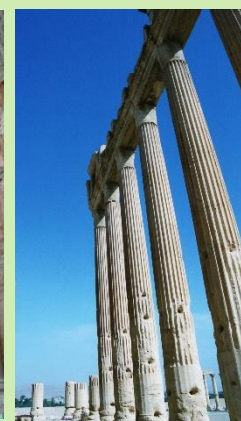
パルミラの神殿の柱