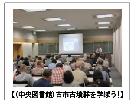
【(中央図書館)古市古墳群を学ぼう!】

両館ともに感染拡大防止のため予定していたイベントなどを中止や延期しましたが、感染拡大防止に努めつつ、2年度も引き続き魅力あるイベントを提供していきたいと考えています。