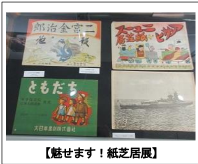
【魅せます！紙芝居展】

障がい者支援室では、夏休みにイベント「見て、聴いて、さわって楽しむ読書の世界」を企画し、手話によるおはなし会やこども点字教室、マルチメディアデジター図書の研修などを実施しました。9月には聴覚障がいのある幼児と保護者を対象に大阪府福祉部が実施している、絵本や遊びにより手話を言語として獲得しようとする