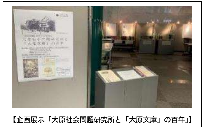
【企画展示「大原社会問題研究所と「大原文庫」の百年」】

障がい者サービスでは、平成 28 年 4 月 1 日施行の障害者差別解消法に対応するべく、府域図書館への研修を積極的に実施しました。また、国立国会図書館視覚障害者等用データ送信サービスへのデータ提供数を着実に増やし、当館提供コンテンツの利用数も大きく増加しました。DAISY をはじめとしたデジタル資料の活用に関する法制度が整備されつつある状況に合わせて、読書に支援が必要な方へのサービスが適切に提供できるよう、今後とも努めていきます。