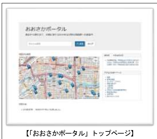
【「おおさかポータル」トップページ】

30年度に構築した「おおさかポータル」が情報発信の拠点となるよう、府域図書館、大学、研究機関等とのデータベース連携の拡充を図り、情報社会の進展とともにますます高度化する利用者のニーズに応えていきたいと考えています。