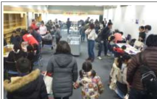
【(中央図書館) 図書館でボードゲームをする日】

これまで図書館利用者からは高い満足度が得られている一方、入館者数は減少傾向にあり、新規利用者の獲得が課題となっています。その第一歩として、図書館に来館してもらう機会を創り出すことが必要です。中央図書館では第三期に続き、外部機関との連携による生涯学習事業の拡充を第四期の重点目標とします。中之島図書館では、第四期に向けては「大阪の歴史と商い」を基本コンセプトとして、指定管理者との連携を今後一層強化し、多彩な事業展開を通じて、大阪の「魅力」についての情報発信に努めます。