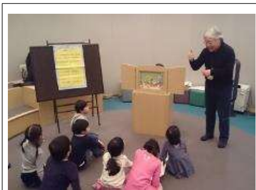
【手話を用いたおはなし会「楽しい手話」】

24 年度から府立図書館の職員が講師を務めている「子どもの読書活動推進支援員養成講座（派遣）」は、第三期中にすべての図書館未設置自治体で開催することができました。