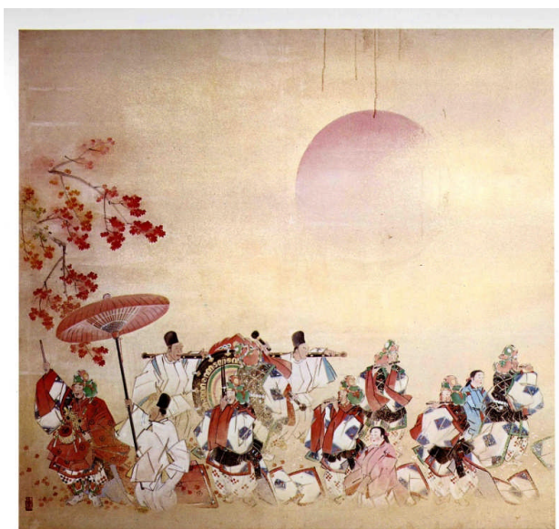
菅楯彦作「道楽（一名：鼈鼓楽）」 昭和33年作（平成21年度寄贈）

「道楽」は、雅楽の演奏形式の一つで、行幸・大葬・神幸の時などに使われる。楽器編成は笙・箏・篳篥・笛・一鼓・荷太鼓 荷鉦鼓で、歩きながら奏でられる。