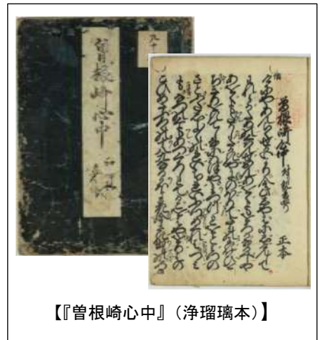
【『菅根崎心中』(浄瑠璃本)】

中之島図書館では、指定管理者との資料展示、講演会といった共同企画事業を順調に開催し、「古文書講座」は従来の内容に加え、切り口を変えた内容のものも行い、好評でした。