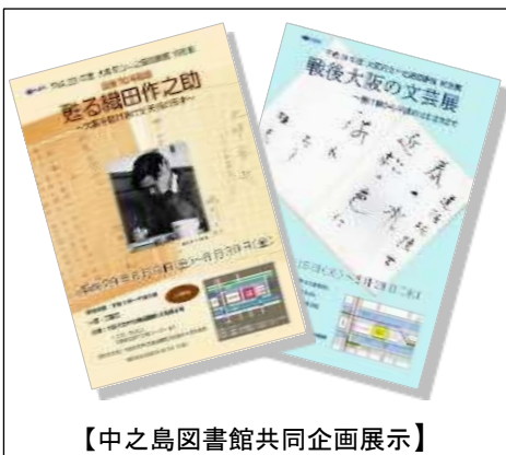
【中之島図書館共同企画展示】

府立図書館は、府民に開かれた図書館として、地域の魅力に会う「場」と機会を提供します。