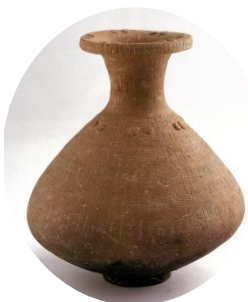
弥生時代の「河内の土器」(壺)