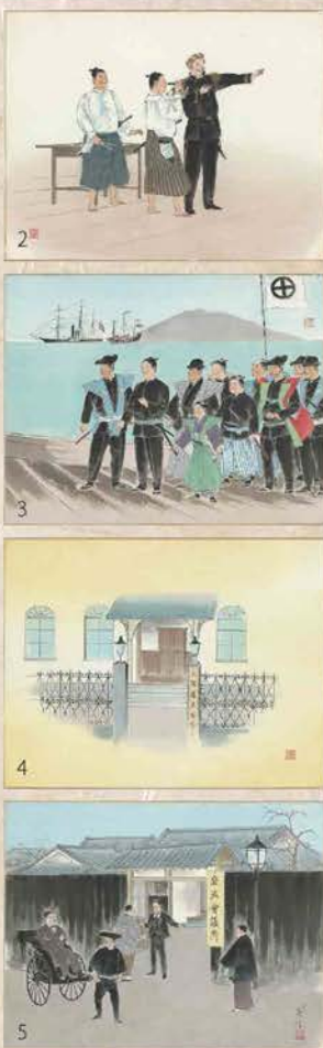
五代友厚（ごだいともあつ） 天保六年十二月二十六日〜明治十八年 九月二十五日（1836〜1885） 鹿児島生まれ。実業家。 大阪経済界の重鎮の一人。 「まさに瓦解に及ばんとする萌し」 のあつた大阪経済を立て直すために、 商工業の組織化、信用秩序の再構築を 図った。

大阪株式取引所、大阪商法会議所、 大阪商業講習所（大阪商科大学の前身） などを設立し、大阪の経済発展に 貢献した。