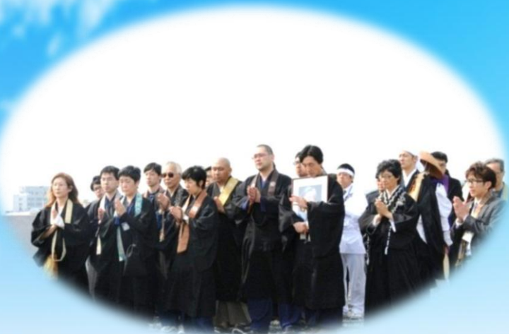
写真：「石巻 追悼法要」2014/5/20 東北大学と龍谷大学合同研修の光景

講演会では、宮城県南三陸町など被災地で行った震災被災者への心の支援活動を中心にお話させていただきます。