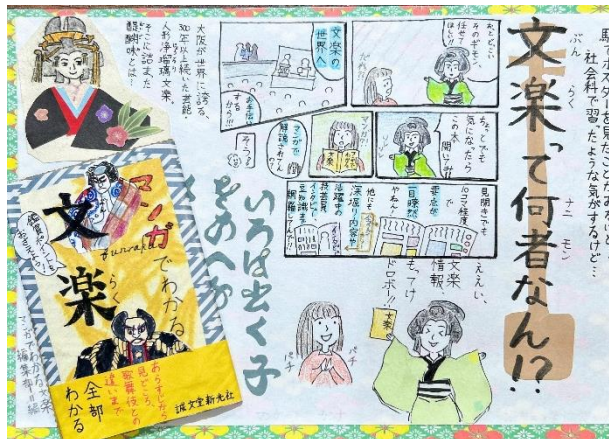
第18回 中学生の部 最優秀賞作品