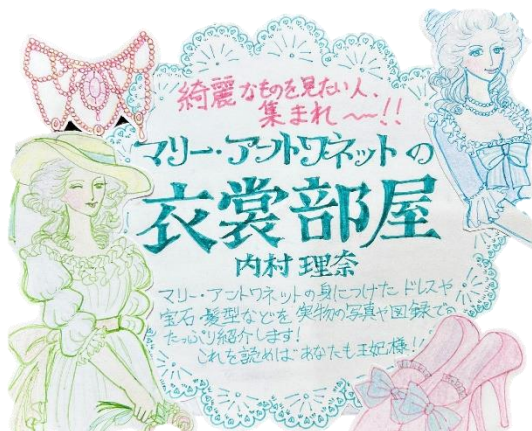
第18回 高校生の部 最優秀賞作品