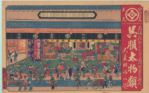
「[ 呉服商あはや引札 ]」【枚 44】