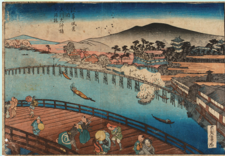
「大川天神橋天満橋」【大和銀 166】