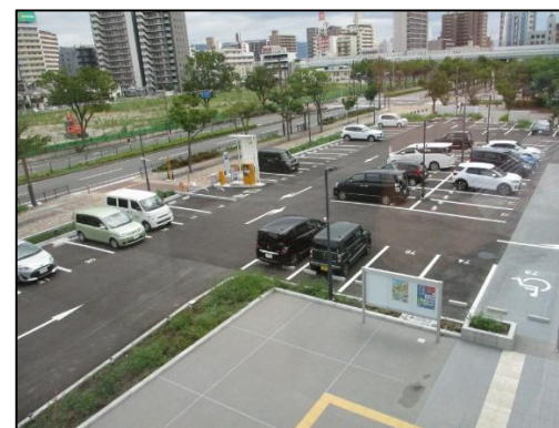
平面駐車場・・・本年8月より利用開始