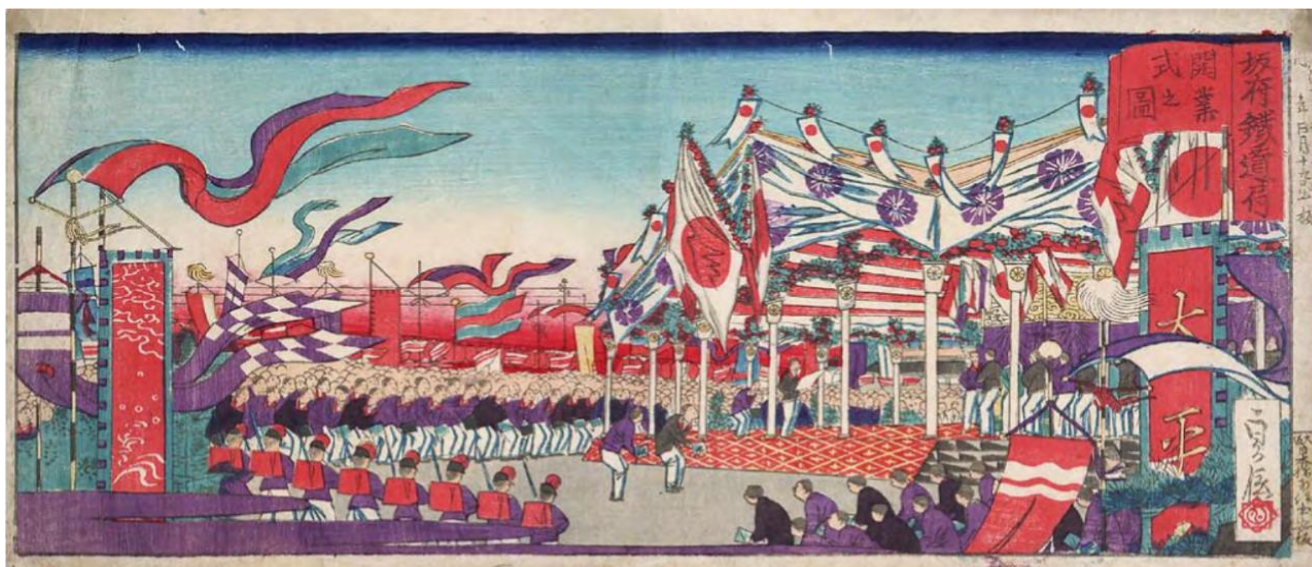
『坂府鉄道局開業式之図』【甲雑/93/#】 ※貴重書