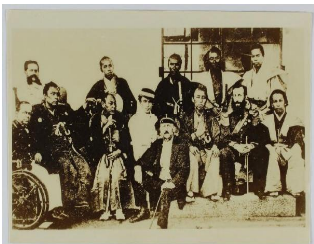
『ボードウケン・ハラタマ写真』 【甲雑/155/#】 ※貴重書

※QRコードは大阪府立図書館デジタルアーカイブ「おおさかeコレクション」へのリンクです。