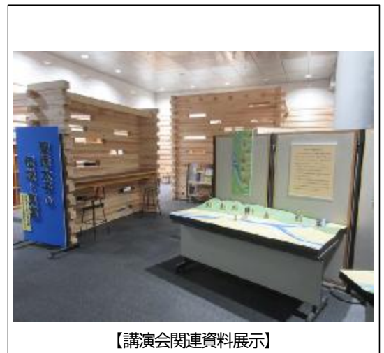
【講演会関連資料展示】

外部機関との連携をさらに深め、「利用者にとどのような学びを提供することができるか」「未利用者の方にも気軽に利用していただくための工夫」等を検討します。より多くの府民に図書館の魅力や活動を届けられるよう、様々な媒体を活用した情報発信に努めます。