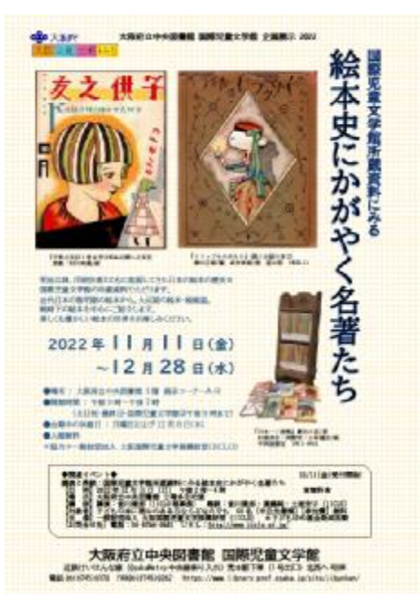
【国際児童文学館所蔵資料にみる 絵本史にかがやく名著たち】展チラシ

府立図書館は、府域の子どもが豊かに育つ読書環境づくりを進めるとともに、国際児童文学館の機能充実に努めます。