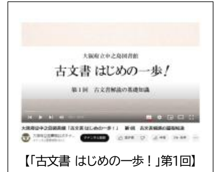
【「古文書 はじめの一歩！」第1回】

非来館型利用促進の一環として、資料のデジタル化を着実に進め、また行政資料等のデジタル資料の収集を継続し、デジタルコンテンツの拡充と認知度向上に努めます。中でも第五期では、2025年日本国際博覧会関係資料を積極的に収集したいと考えています。