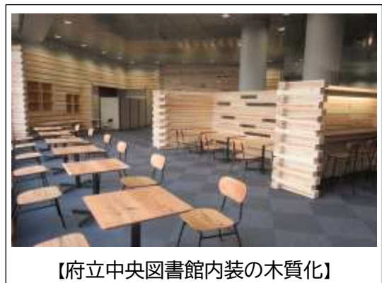
【府立中央図書館内装の木質化】

今後ともウィズコロナの状況や中之島図書館の書庫建替工事に係る施設の状況等を踏まえつつ、企画の工夫などを重ねたいと考えています。