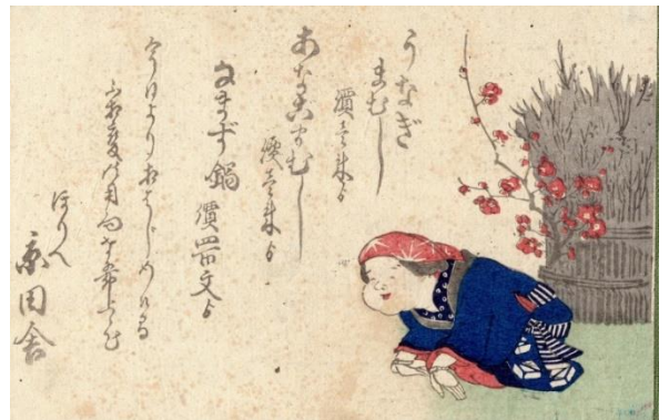
『浪華料亭名物広告』

『浪華料亭名物広告』11枚 (明治) 【542.4-8】彩刷木版 明治時代の料亭のお品書き、広告を貼り合わせまとめたもの。「大阪の食い倒れ」に表される高級料理店の格式、風流な様子が伝わる。