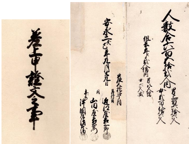
『農人橋二丁目 差上申証文之事』