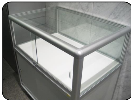
④ 展示ケース D・2台 縦：60cm・横：90cm 高さ：32.7cm(ガラス部分)