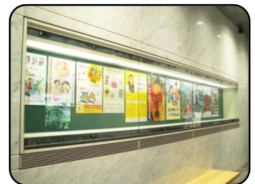
⑤ ポスターケース・2ヶ所 縦：79cm・横：6m・奥行：43cm