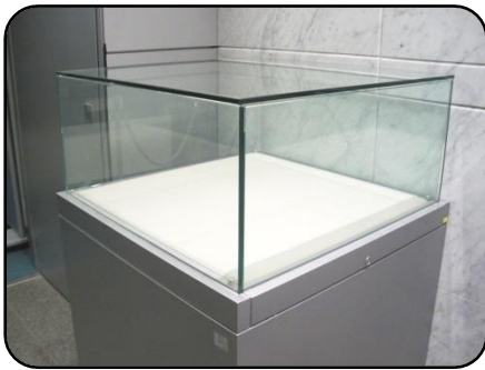
① 展示ケース A・5台 縦：75cm・横：75cm 高さ：35cm(ガラス部分)