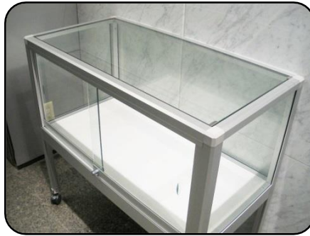
② 展示ケース B・1台 縦：45cm・横：90cm 高さ：40cm(ガラス部分)