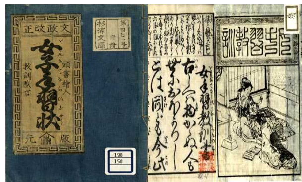
女手習教訓書（ 文政 改正女子手習状）

今年400年を迎える朝鮮通信使は大阪の港に上陸し江戸へ向かったが、その宿には自ら作った漢詩を携えて教えを請いに駆けつけた文化人がいたという。瓦版を買い、黄表紙などの本を貸し本屋から借りて読むことも行われた。