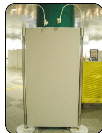
⑦ 展示パネル 縦：172cm・横：90cm 複数枚のパネルを繋げて使用可能