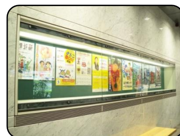
⑤ ポスターケース・2ヶ所 縦：79cm・横：6m・奥行：43cm