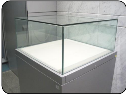
① 展示ケース A・5 台 縦：75cm・横：75cm 高さ：35cm(ガラス部分)