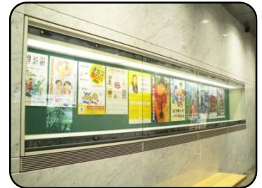
⑤ ポスターケース・2ヶ所 縦：79cm・横：6m・奥行：43cm