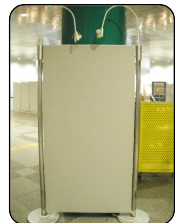
⑦ 展示パネル 縦：172cm・横：90cm 複数枚のパネルを繋げて使用可能