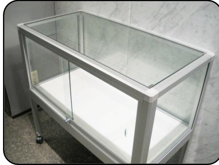
② 展示ケース B・1 台 縦：45cm・横：90cm 高さ：40cm(ガラス部分)