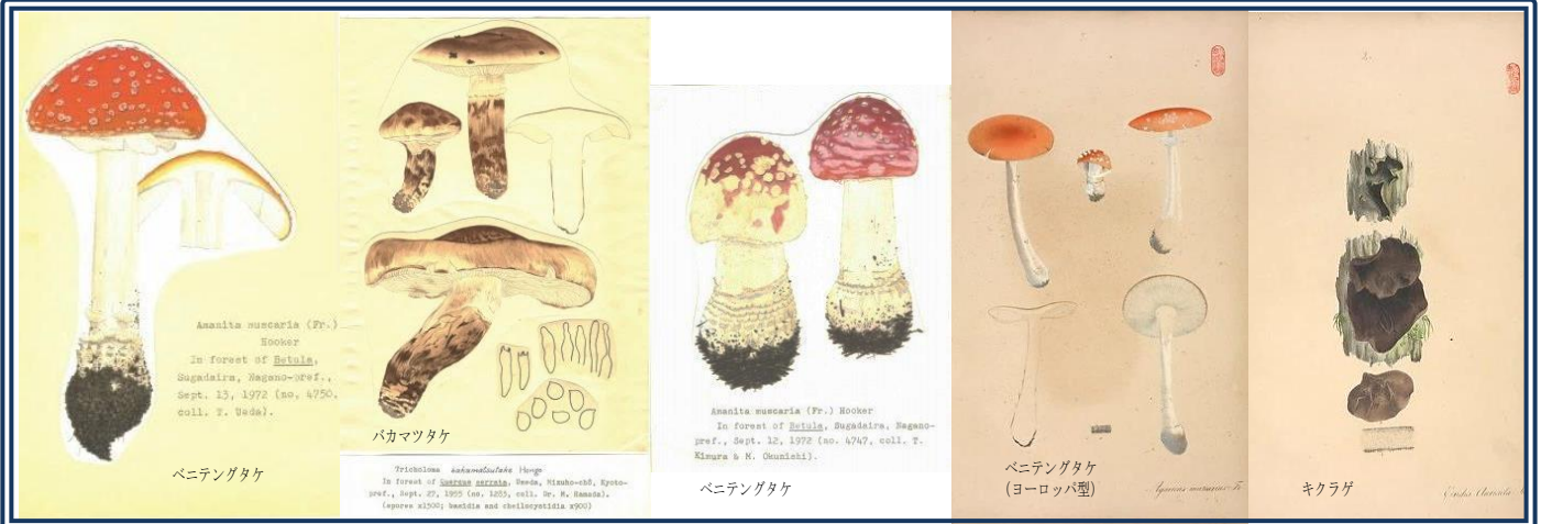
左から3枚「本郷次雄菌類図譜」より（大阪市立自然史博物館所蔵）