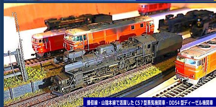
播磨線・山陰本線で活躍したC57型蒸気機関車・DD54型ディーゼル機関車