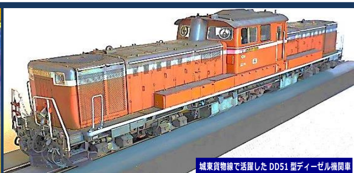
城東貨物線で活躍したDD51型ディーゼル機関車