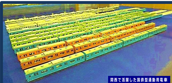
関西で活躍した国鉄型通勤用電車