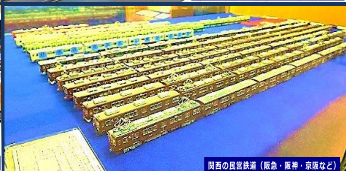
関西の民営鉄道（阪急・阪神・京阪など）