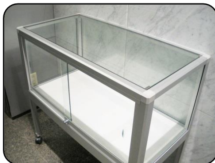
② 展示ケース B・1 台 縦：45cm・横：90cm 高さ：40cm(ガラス部分)