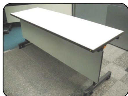
⑥ 長机・7脚程度 縦：60cm・横：180cm 高さ：70cm