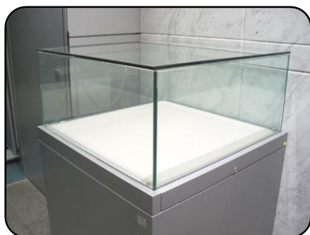
① 展示ケース A・5 台 縦：75cm・横：75cm 高さ：35cm(ガラス部分)