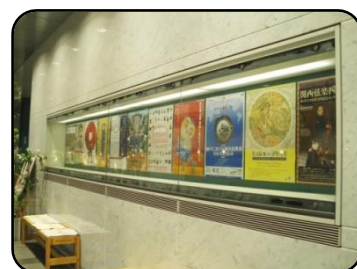
⑤ ポスターケース・2ヶ所 縦：79cm・横：6m・奥行：43cm