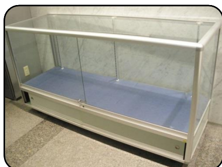
③ 展示ケース C・2 台 縦：60cm・横：180cm 高さ：60cm(ガラス部分)