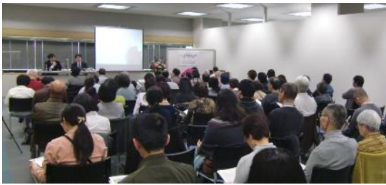
【国際児童文学館講演会】 『メディアを横断する「賢治」』より)

府立図書館は、府域の子どもが豊かに育つ読書環境づくりを進めるとともに、国際児童文学館の機能充実に努めます。