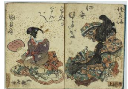
【おおさかeコレクション】 （「近世後期小説類」より『修紫田舎源氏』）

29年度は、「おおさかeコレクション」掲載データを増やし、「デジタル大阪ポータル」（仮称）の実現に向けて更に準備を進め、大阪に関する情報発信の強化に努めます。