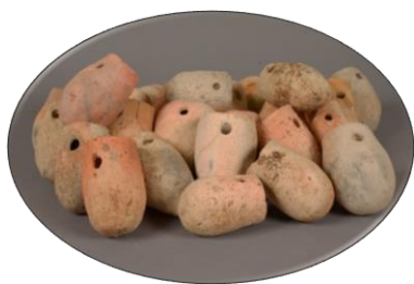
イダコ壺 (大阪府立弥生文化博物館所蔵)