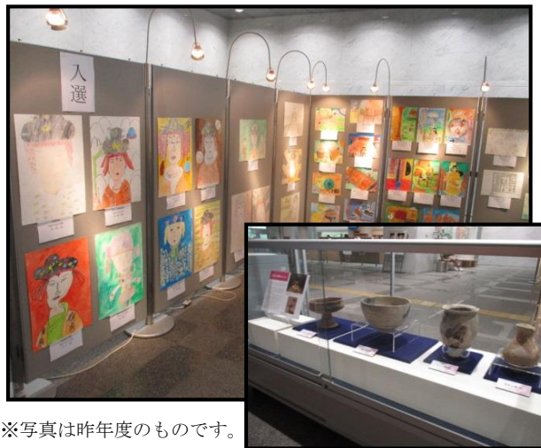
※写真は昨年度のものです。

併せて、今年も弥生時代のイダコ壺（大阪府立弥生文化博物館所蔵）を展示します。遙か昔のイダコ壺は現代のものと似ているのか、それとも全く違うのか。興味のある方はぜひ図書館へ！