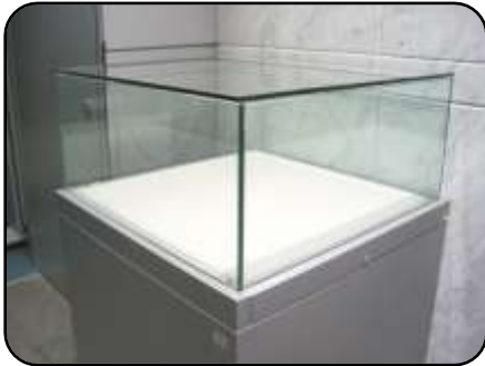
① 展示ケース A・5 個 縦：75cm・横：75cm 高さ：35cm(ガラス部分)