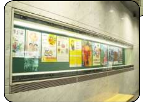
⑤ ポスターケース・2ヶ所 縦：79cm・横：6m・奥行：43cm