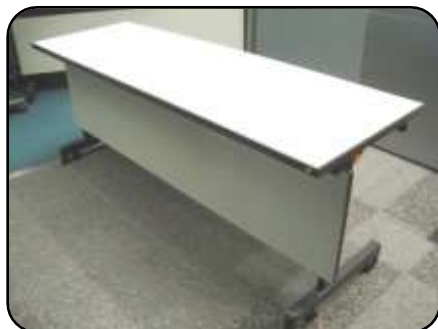
⑥ 長机・6脚程度 縦：60cm・横：180cm 高さ：70cm