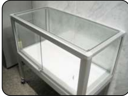
② 展示ケース B・1 個 縦：45cm・横：90cm 高さ：40cm(ガラス部分)