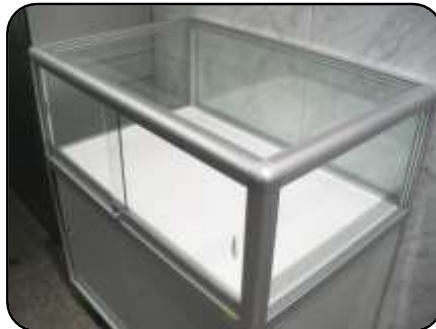
④ 展示ケース D・1 個 縦：60cm・横：90cm 高さ：32.7cm(ガラス部分)