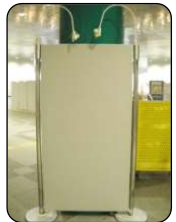
⑦ 展示パネル・35枚程度 縦：172cm・横：90cm 複数枚のパネルを繋げて使用可能