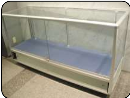
③ 展示ケース C・1 個 縦：60cm・横：180cm 高さ：60cm(ガラス部分)