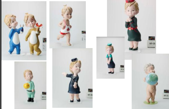
ローズちゃん人形