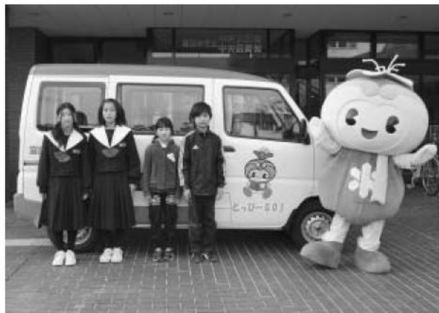
新しいブック便配本車「とっぴーGO！」と愛称が採用された4人の児童・生徒

新しい配本車の愛称を、市立小・中学校の児童・生徒から募集したところ、333件の応募がありました。その中から審査の結果、