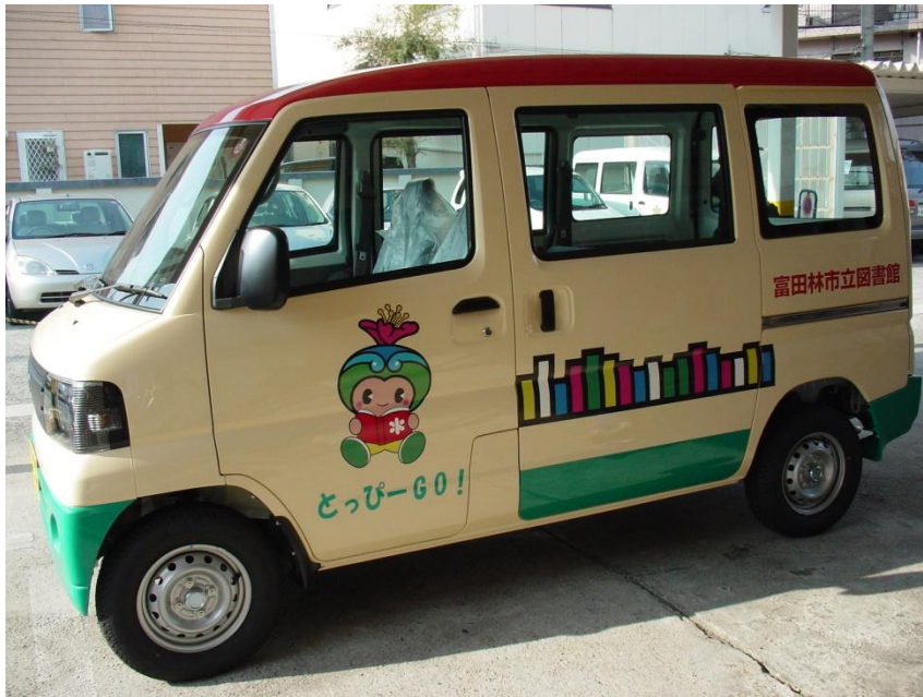
ブック便配本車「とっぴーGO!」